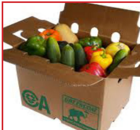
cartón recubierto de cera