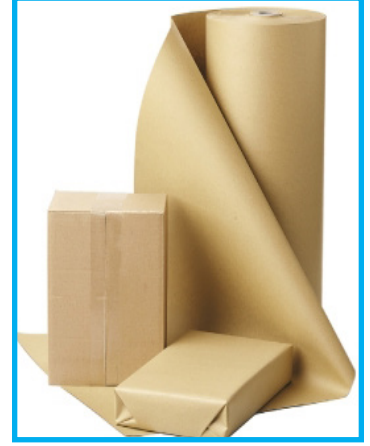
Limpio, corrugado (con crestas), cajas de cartón aplanadas y papel marrón.