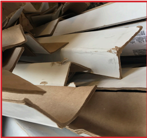
cartón no corrugado