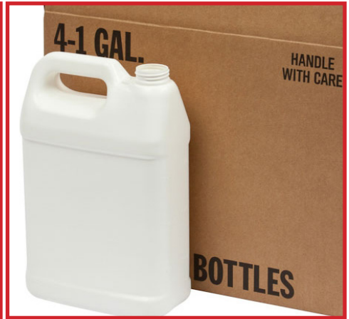
recipientes de aceite de cocina