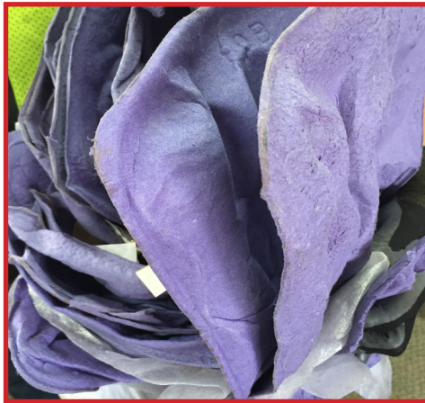
embalaje no corrugado